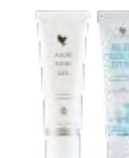
Aloe MSM Gel & Aloe Cooling Lotion