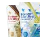
Forever Lite Ultra™