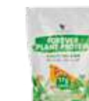
Forever Plant Protein™